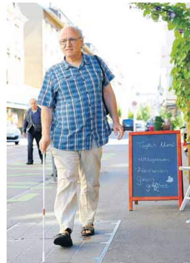
Unterwegs im Quartier behilft sich der Sehbehinderte mit Hilfsmittel, um sein visuelles Handicap auszugleichen...